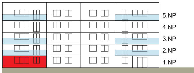
Východní pohled na dům/ Building View - East side